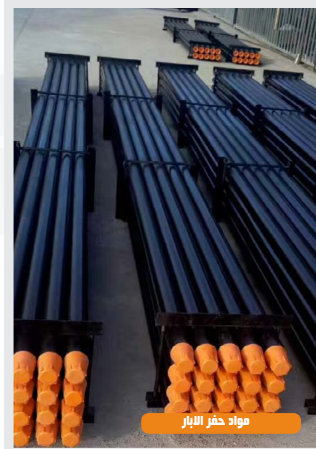
مواد حفر الآبار